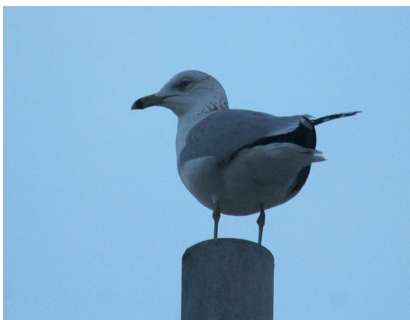
Gaviota de Delaware 01-02-2014

Tampoco observamos al Correlimos oscuro ( Calidris maritima ) observado el lunes 27 y martes 28/01/2014 junto a 4 vuelvepedras.