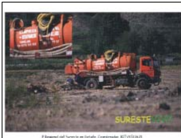
Equipo de desatrancos de alcantarillado, vertiendo en «La Aldehuela».