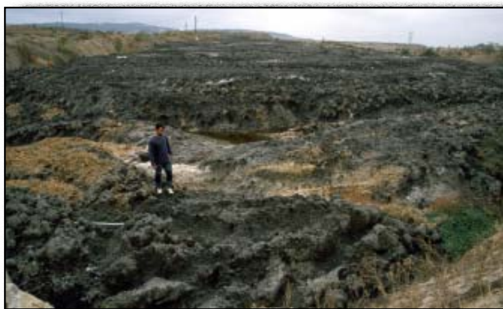
Lodos de depuradora

La Fiscalía de Medio Ambiente tiene abiertas diligencias por los daños producidos en el espacio protegido del Parque del Sureste