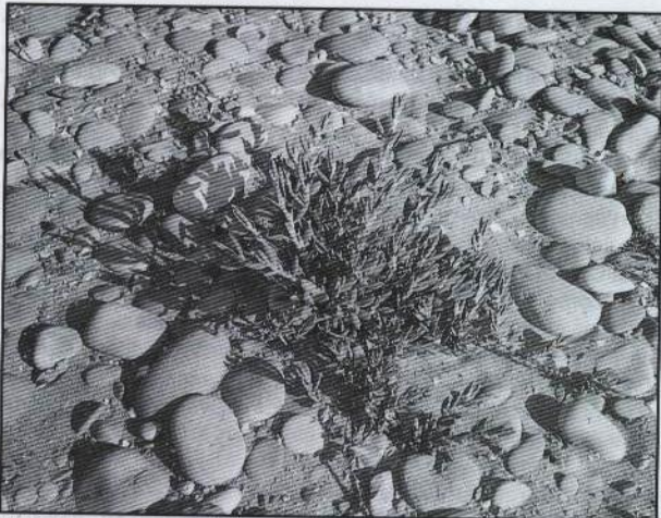
2. Polygonum maritimum en la playa norte de Peñíscola (15-III-2000)

CASTELLÓN: 30TYK4764, Culla, serra d'Espaneguera, barranc Fondo, 945 m, J.M. Aparicio , 28-V-2002. 30TYK4867, Torre d'en Besora, base de la serra d'Espaneguera, 680 m, J.M. Aparicio , 18-V-2002. 31TBE4770, Albocàsser, barranco, 655 m, J.M. Aparicio & J.M. Mercé , 2-VII-2002.