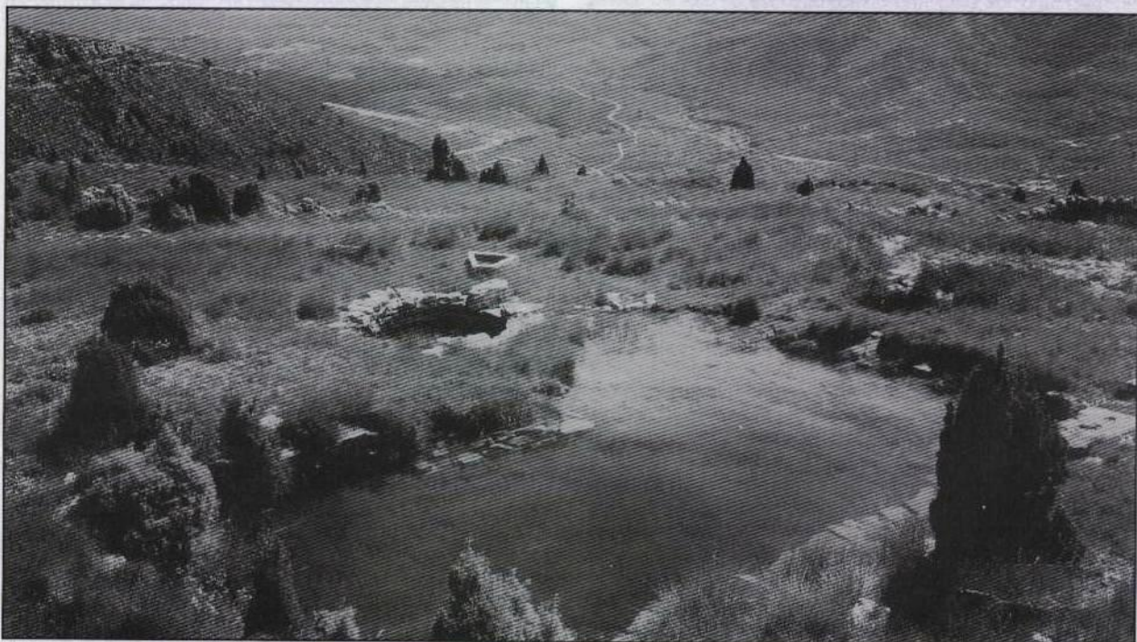
3. Pou y bassa de la Serra, en la serra d'Espaneguera o d'Esparreguera (Culla)

BF40-BF51 son nuevas cuadrículas para el Baix Maestrat (cf.