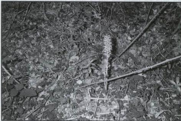
Neottia nidus-avis en las proximidades de Bel (Rossell)

BE68 es nueva cuadrícula de 10 x 10 km del retículo UTM, no reseñada en VILLAESCUSA (2000: 132) y APARICIO (2002: 48).