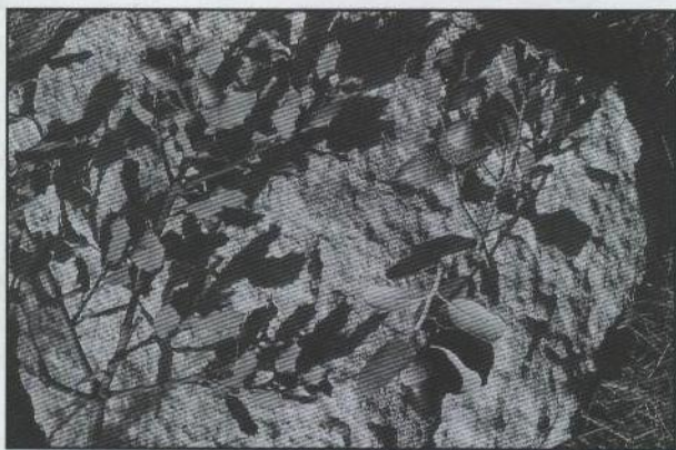
Híbrido de carrasca y coscoja (rama de la izquierda), con sus parentales, abundante en la Tossa (Càlig-Benicarló) antes de sufrir repetidos incendios.

BE68 es nueva cuadrícula para el Baix Maestrat, según VILLAESCUSA (2000: 132) y APARICIO (2002: 48).