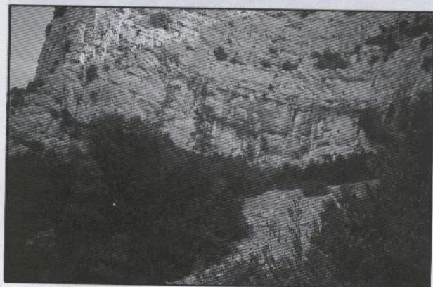
Rincón con tejos y boj en el barranc de l'Ullastre o del Trinxant (Rossell)

Esta "menta de gatos" aparece raras veces