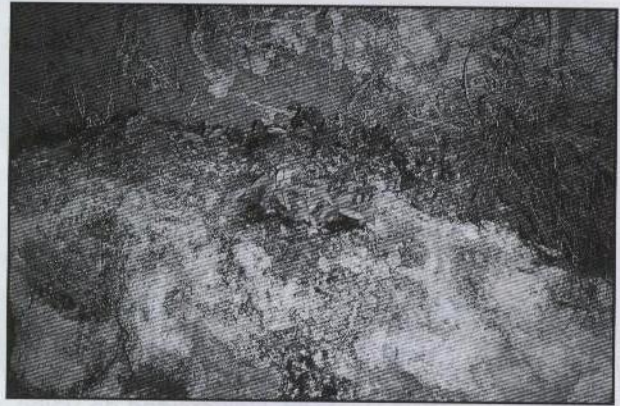
Pinguicula dertosensis , en el racó de l'Avellaner (Pobla de Benifassà, Fredes)

Ocasionalmente cultivada como planta ornamental y medicinal, esta matricaria se ve asilvestrada por los alrededores de la descuidada ermita de