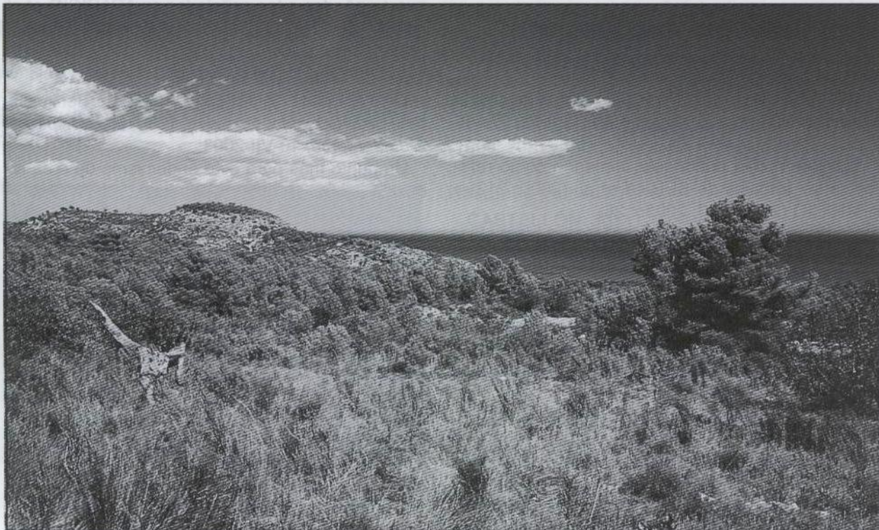
Parc Natural de la Serra d'Irta

(*) Asociación Protectora de la Naturaleza Levantina (A.P.N.A.L.) – Ecologistas en Acción. Apartado 237. 12500 Vinaròs (Castellón). C.e.: tollnegre@mixmail.com