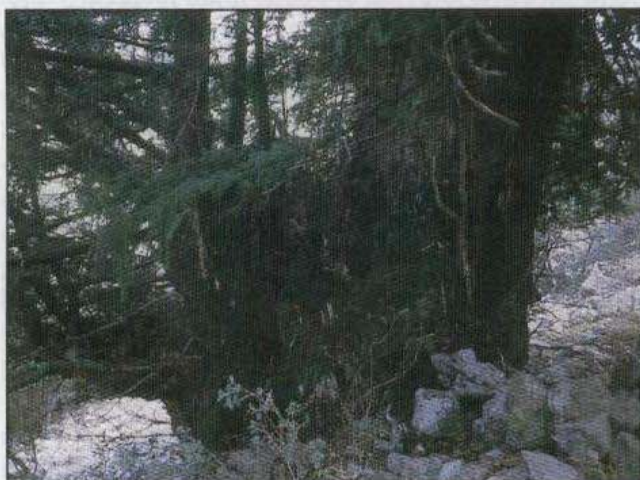
Tejo ( Taxus baccata ) monumental en los alrededores de Ares del Maestre