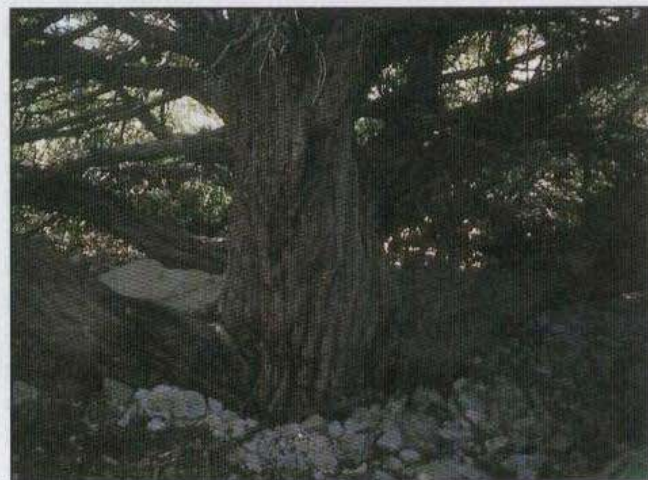
Secular tejo situado en el municipio de Serra d'en Galceran