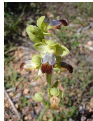
Ophrys gr. fusca

Más información: APNAL-Ecologistas en Acción-Vinaròs. Tlf: 610604180